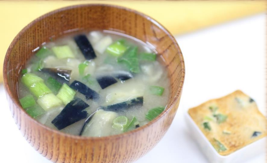
大阪府産水なす合わせ味噌仕立てのお味噌汁