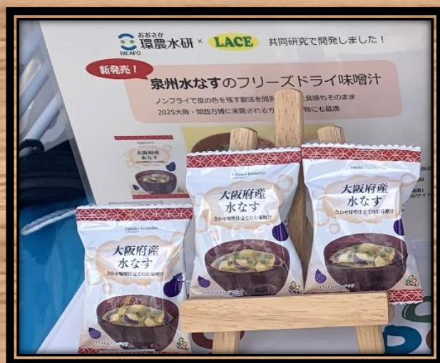
2023年11月11, 12日 てんしばにて