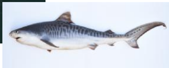
温暖化の影響?! 近年、大阪湾で漁獲された暖海性魚類のイタチザメ