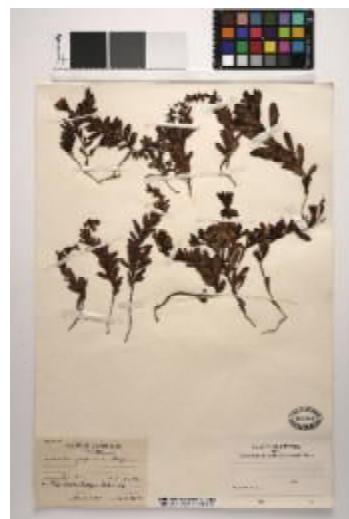
大阪湾から絶滅した海浜植物ウンランのさく葉(押し葉)標本