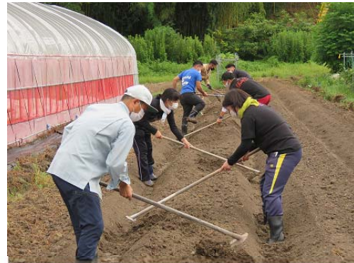
指導者・支援者向け栽培実習風景