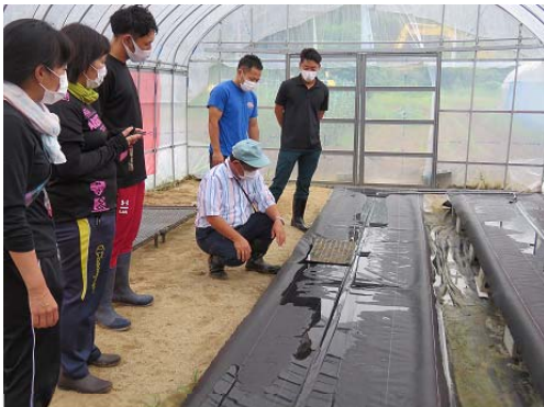
障がい者が取り組みやすい技術紹介

※ハートフル農業とは：障がい者や高齢者の就労や就労訓練、生きがいを創り のために行う農業や園芸作業のこと