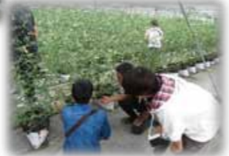
校外実習では、近隣の先進地農業を視察します。