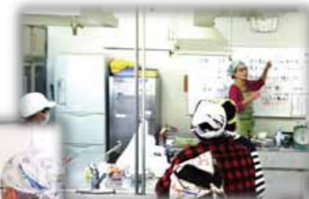
座学では、大学や各分野の専門家の先生に、農業関係の幅広い分野を学びます。