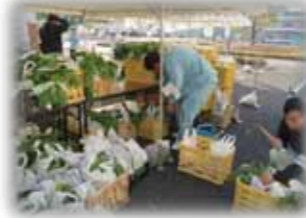
農業祭では、自分たちががんばって育てた農産物や手料理を販売します。