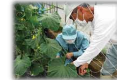
ほ場では、大阪の地域に応じた実践的な農業知識について、教員がくわしく説明します。