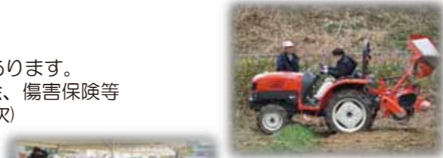
実習では農業に必要な機械の操作実習も行います。