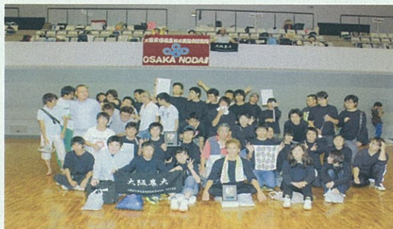
東海近畿地区農業大学校学生スポーツ大会(滋賀県)

(2) その他 教科書、実習服、農家実習、校外学習、教育後援会、傷害保険等 約150,000円(1年次)、約130,000円(2年次) 入学検定料及び入学金は不要です。