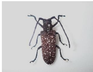
サビイロクワカミキリ