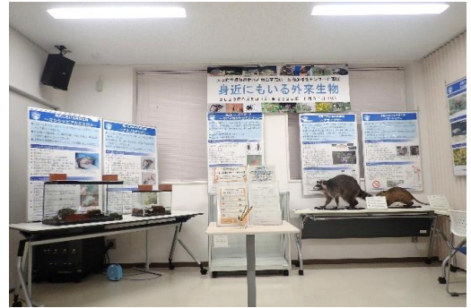
現在の展示の様子

展示場所 大阪府立環境農林水産総合研究所 生物多様性センター 本館内企画展示エリア （寝屋川市木屋元町10-4）