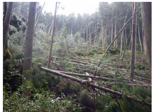
台風による倒木被害の写真（大阪府内） 2018年10月11日撮影