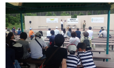
子供向けイベントの実施