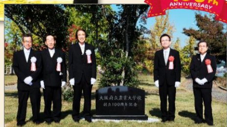
創立100周年 記念碑の除幕式。 これからも新たに 歴史を刻みます。