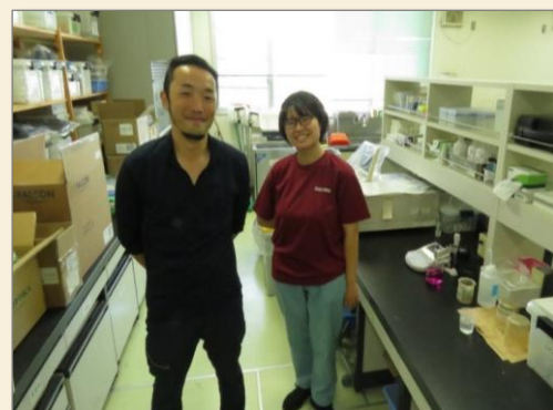
研究員の指導を受け、たくさんのことを学びます。