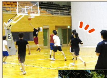
学生同士や他府県の農業大学校との交流活動もあります。