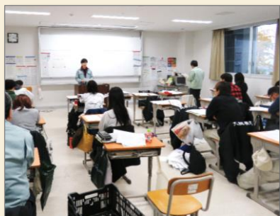
科学的な知識に基づく栽培管理や最先端技術も学びます。