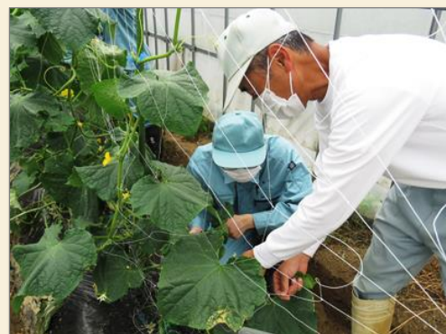
ほ場では、大阪の地域に応じた実践的な農業知識について、教員がくわしく説明します。