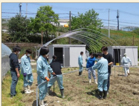
ビニールハウスも自分たちで建てます。