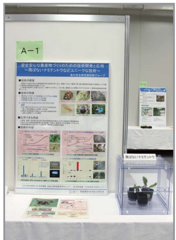
調査研究の成果について展示