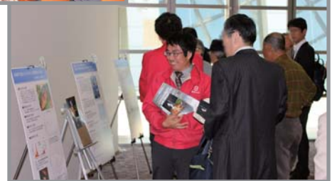
ポスターセッション会場