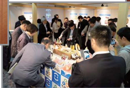
ポスターセッション会場