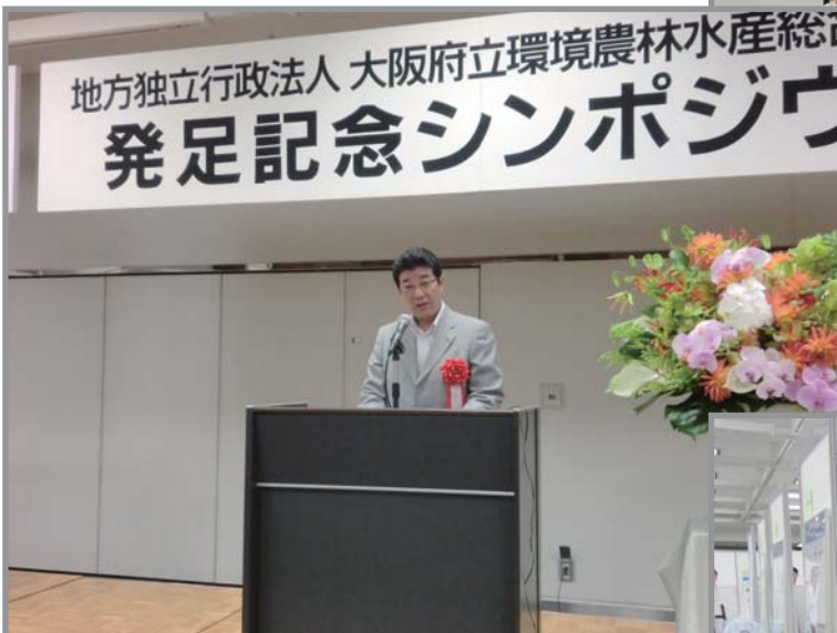
松井知事（当時）のあいさつ