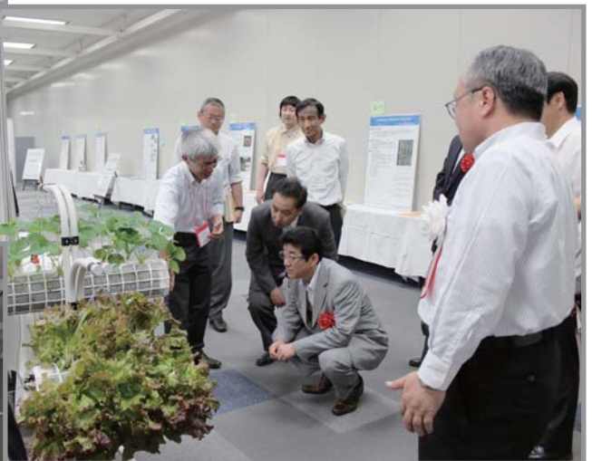
知事に展示物を説明