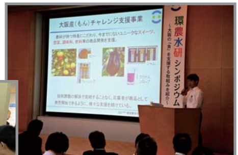
3つの研究成果について口頭発表

『おびやかされる私たち ●●に狙われている！ナニワの危機を生物多様性が救う?!』 (2018[平成30]年11月8日・大阪歴史博物館)