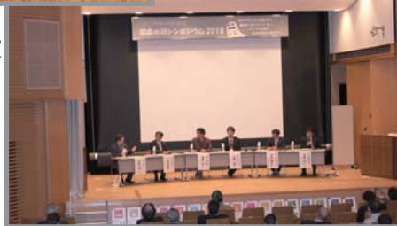
話題提供者によるパネルディスカッション