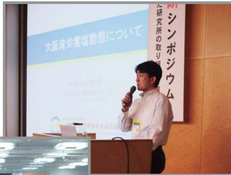
6つの研究成果 について発表