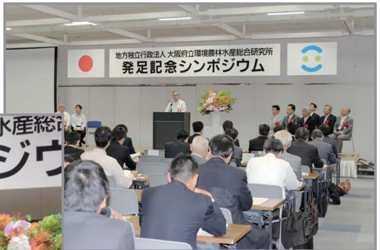
大河内理事長（当時）のあいさつ