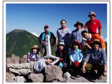
北横岳山頂で！（登山部）