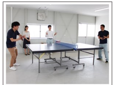
卓球トーナメント大会（卓球愛好会）