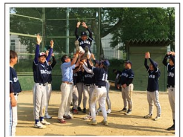
環境農林水産部室課対抗野球大会（野球部）