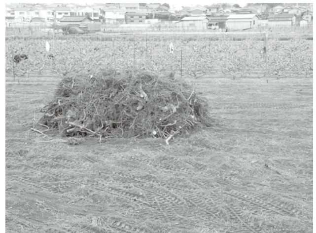
Figure 3. Heavy damage of soil sickness forces the farmers to grub out all of the fig trees and to rotate other crops.

は認められ、被害率、被害指数ともに中齢樹(6~9年生)で高かった。また被害率、被害指数ともに新植に比べて補植樹で明らかに高く、連作障害としての特徴が確認された。