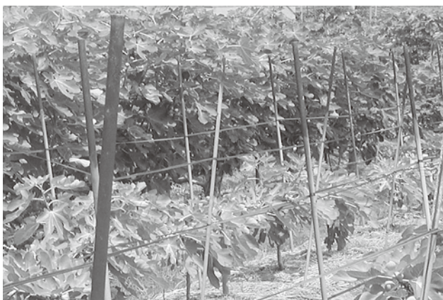
Figure 1. The front trees show the symptoms of soil sickness with heavy damage; the behind trees are healthy with optimum growth.

2003年から2008年にかけて、視察や講演などの機会を利用し、国内7府県(静岡、愛知、滋賀、京都、大阪、和歌山、兵庫)の9産地、述べ222人のイチジク‘梺井ドーフィン’生産者に対し、いや地現象の経験についてアンケート調査を行った。アンケートは、調査1で観察されたいや地現象の特徴を予め説明した上で、各自のイチジク園において、同様の被害経験を持つか否かを質問した。また被害経験有りとした場合、その被害が補植に